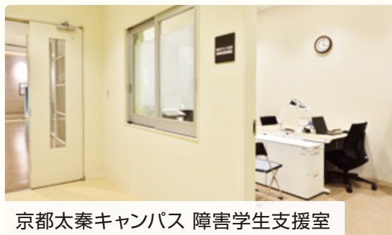
京都太秦キャンパス 障害学生支援室