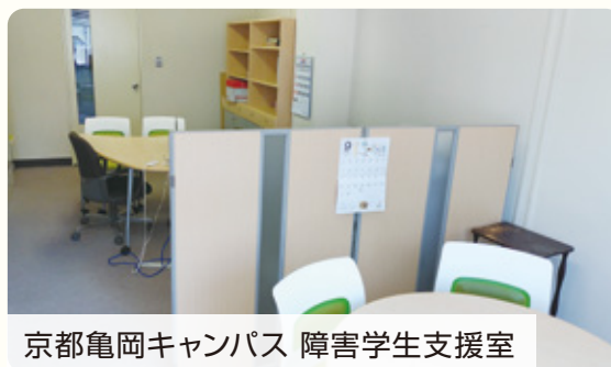
京都亀岡キャンパス 障害学生支援室