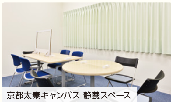
京都太秦キャンパス 静養スペース

主に講義や実習等の修学に困難を抱える学生に対し、保健室、学生相談室、関係する教職員等の各部門と連携、協議し、合理的配慮の提供にかかる支援を行っています。