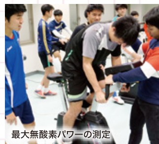
最大無酸素パワーの測定