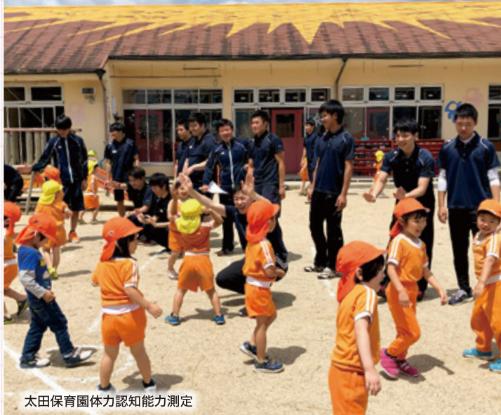
太田保育園体力認知能力測定

【子ども×遊び・スポーツ】体力・コーディネーションスキルアップ意欲・認知活動・社会性の向上