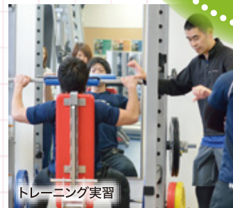
トレーニング実習