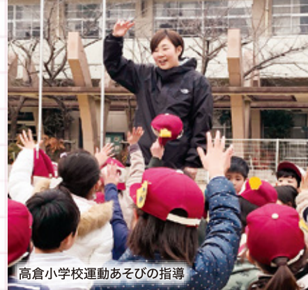
高倉小学校運動あそびの指導