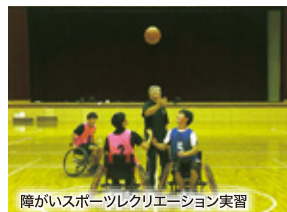
障がいスポーツレクリエーション実習