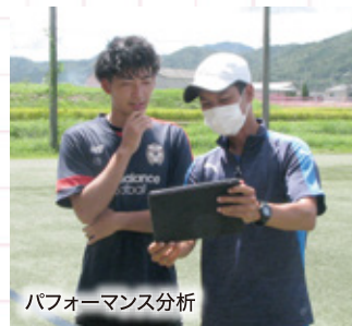
パフォーマンス分析