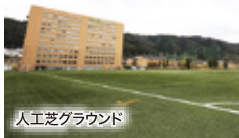
人工芝グラウンド