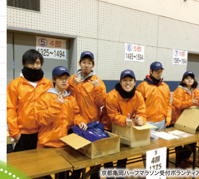
京都亀岡ハーフマラソン受付ボランティア