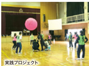
実践プロジェクト