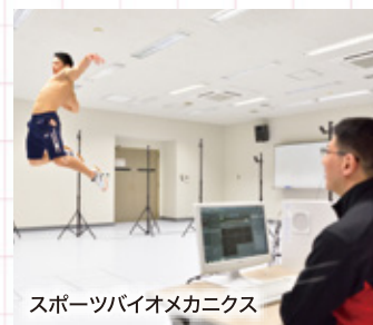
スポーツバイオメカニクス