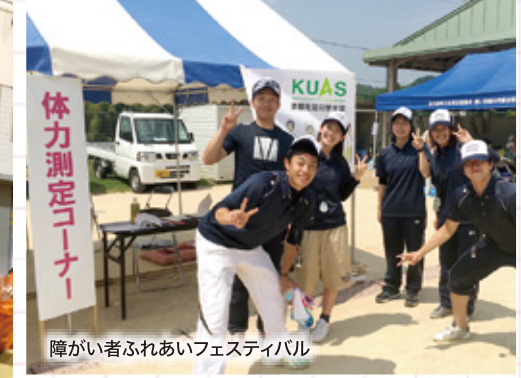
障がい者ふれあいフェスティバル