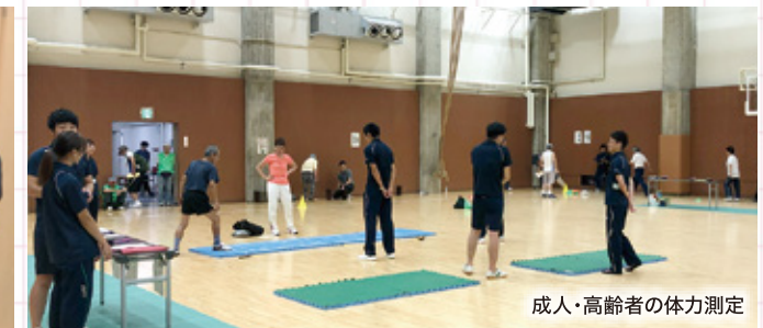
成人・高齢者の体力測定